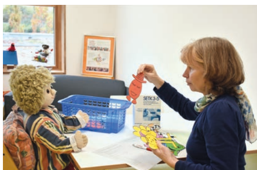
Therapeutinnen bei der Arbeit mit den Kindern im SPZ

Viel Arbeit steckt auch in der Aktion »Kinder helfen Kindern« : Gesunde Kinder gestalten im Kunstunterricht Bilder und Objekte aus vielfältigen kleinen Einzelteilen der Produktion der Fa. Prym Fashion, die auf Schulfesten und sonstigen Veranstaltungen gegen eine Spende einen Liebhaber finden konnten. Firmeninhaber, Jubilare oder auch trauernde Menschen, die von unserer Arbeit gehört haben, bitten um Spenden für das SPZ – anstelle von Geschenken und Blumen.