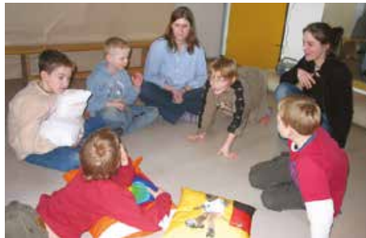
Therapeutinnen bei der Arbeit mit den Kindern im SPZ

Viel Arbeit steckte auch in der Aktion »Kinder helfen Kindern« : Gesunde Kinder gestalten im Kunstunterricht Bilder und Objekte aus vielfältigen kleinen Einzelteilen der Produktion der Fa. Prym Fashion, die auf Schulfesten und sonstigen Veranstaltungen gegen eine Spende einen Liebhaber finden können. Firmeninhaber, Jubilare oder auch trauernde Menschen, die von unserer Arbeit gehört haben, bitten um Spenden für das SPZ – anstelle von Geschenken und Blumen.