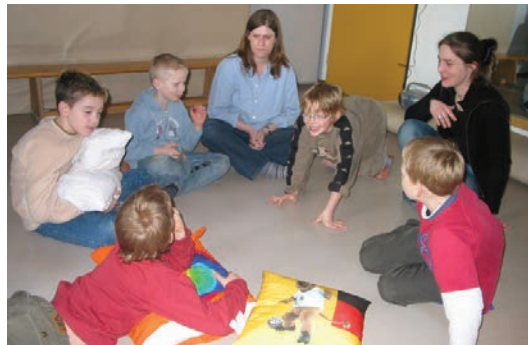
Therapeutinnen bei der Arbeit mit den Kindern im SPZ

Viel Arbeit steckte auch in der Aktion »Kinder helfen Kindern« : Gesunde Kinder gestalten im Kunstunterricht Bilder und Objekte aus vielfältigen kleinen Einzelteilen der Produktion der Fa. Prym Fashion, die auf Schulfesten und sonstigen Veranstaltungen gegen eine Spende einen Liebhaber finden können. Firmeninhaber, Jubilare oder auch trauernde Menschen, die von unserer Arbeit gehört haben, bitten um Spenden für das SPZ – anstelle von Geschenken und Blumen.